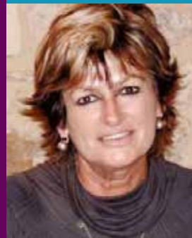
HISTORIENNE DE L'ART